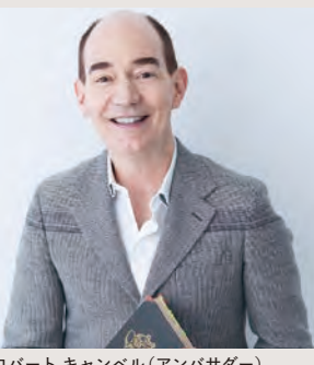
ロバート キャンベル (アンバサダー)